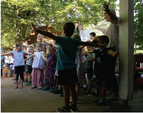
Die Kinder hatten zur Feier des Tages kleine Natur-Lieder und Tänze eingeübt.